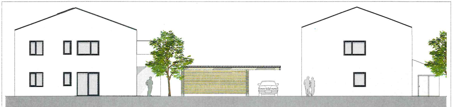
haus 3 ansicht nord