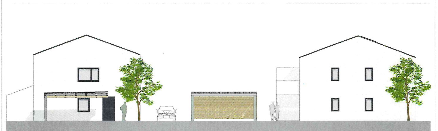
haus 2 ansicht süd